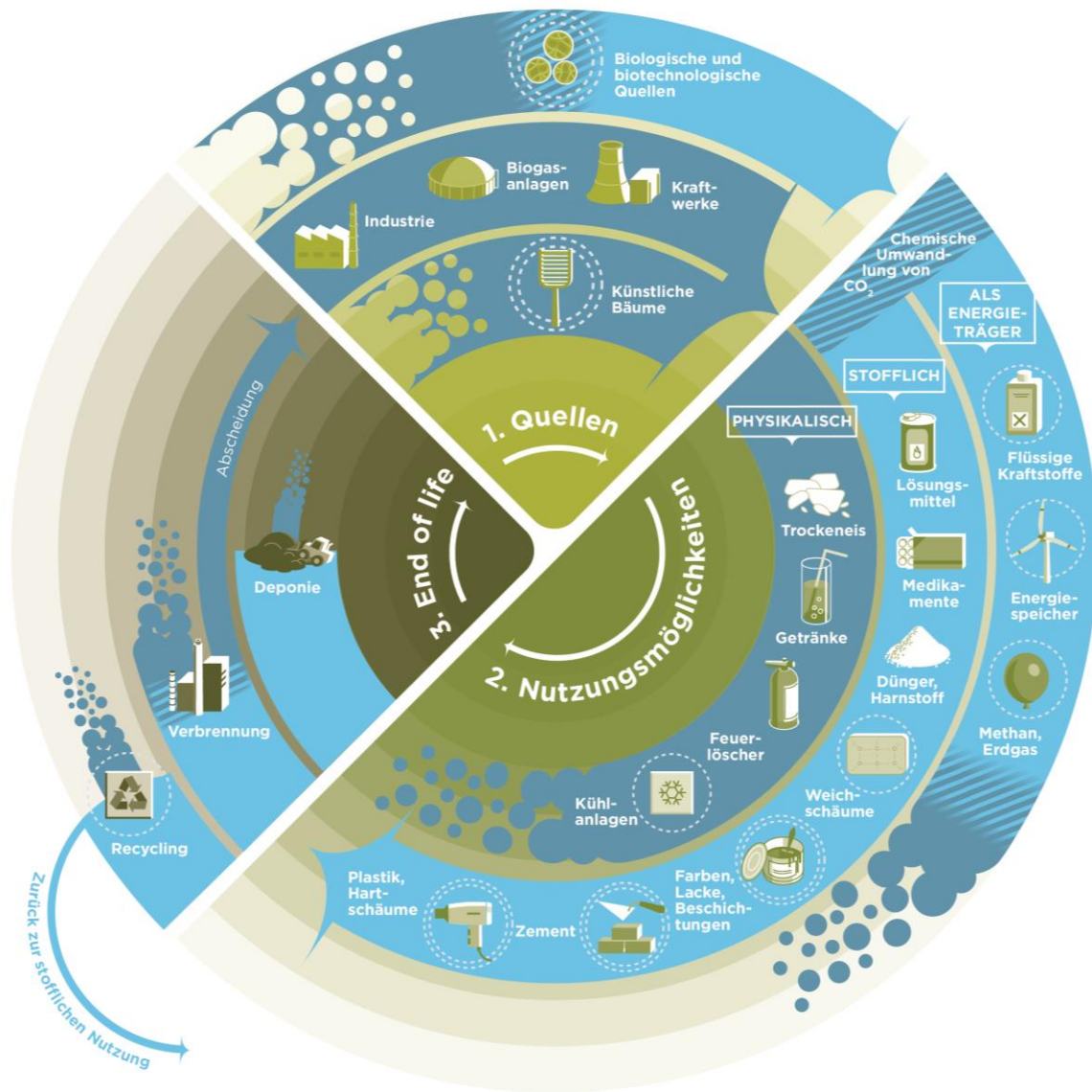
Abbildung 1: Mögliche Wege der CO 2 - Abscheidung und Nutzung